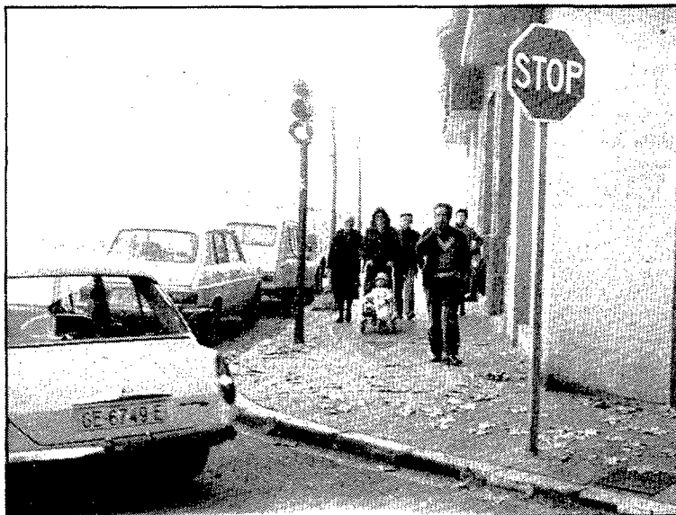
Els semàfors del carrer de Barcelona s'han de coordinar més bé

El primer pas que s'emprenrà és la coordinació de la totalitat de semàfors que hi ha al llarg de la carretera de Barcelona i que crea constants embussos de cotxes ja que quan un és verd altre es posa vermell i és del tot impossible mantenir una regulació en el pas dels vehicles.